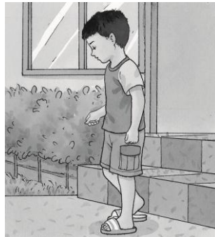
D. สวมรองเท้า

1. ขั้นตอนในภาพใดต้องติดกระดุมหรือรูดซิป