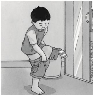
C. สวมกางเกง