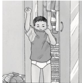
B. สวมเสื้อ